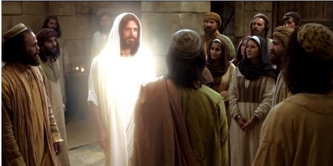
De gedachte van de opstanding schreef Celsus toe aan hallucinaties van de discipelen

nen had (C.C.I.62), en uiteindelijk door zijn Joodse geloofsgenoten en samenleving verworpen werd.