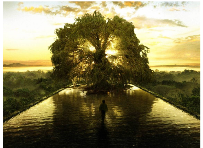
Artist impression van de boom des levens

Tegen de kritiek en geloofsaanvechting in hoorden we de stem van vroege kerkvaders, die zeiden: in de Schrift horen we de stem van God zelf en daarom is het christelijk geloof in principe betrouwbaar. Irenaeus trekt (aan het slot van Tegen de Ketterijen ) een parallel tussen het paradijs en de kerk. Hij schildert aan de ene kant Adam en Eva met de boom des levens in het paradijs. Vervolgens als evenbeeld: de christelijke kerk die rondom de heilige Schriften vergadert. Adam en Eva mochten aanvankelijk eten van de boom des levens, maar dat voorrecht ging verloren