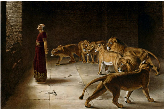
Daniël in de leeuwenkuil is een sprookje, aldus Celsus

die het in het laatste oordeel beter zou vergaan dan menig priester en farizeeër. Ook de profetieën van Daniël nam Jezus ernstig op, als voorspellingen van zaken die nog moesten gebeuren (Matth. 24:15). Met name hoofdstuk 8-12 van Daniël bevat veel informatie over een toekomstige Messias en wijst chronologisch op de komst van de Christus in de tijd van Jezus. Om dit te ondermijnen, kwam Porphyrius met de gedachte dat het hele boek Daniël pseudepigrafisch was. 14 Daniël zelf had het nooit geschreven, maar het was een paar honderd jaar later uitgedacht en de "gruwel der verwoesting" (Dan. 11:31; 12:11) had reeds plaatsgevonden. 15 Jezus had dus ongelijk, want die dacht niet alleen dat Daniël het geschreven had, maar ook dat de gruwel der verwoesting zag op een